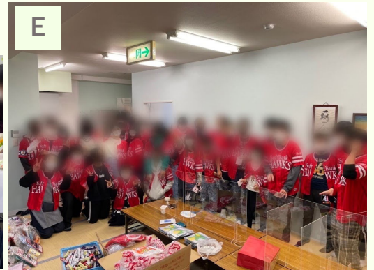
C. お手伝いもやってくれます (クリスマス会) D. みんなで「カンパイ！」 (クリスマス会) E. いただいたSoftBankホークスのユニホームを着て集合写真 (クリスマス会)