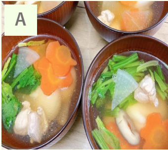
A. 代表手作りお正月メニュー、お雑煮 B. クリスマス会メニュー ワンプレートだけど、お腹いっぱい！